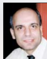
Ηλίας Καραπάντζος, Καθηγητής (Αμ. Επ.) Ωτορινολαρυγγολογίας του Δημοκρίτειου Πανεπιστημίου Θράκης, Καθηγητής Ανατομικής Σχολών Υγείας, Ανωτάτης Τεχνολογικής Εκπαίδευσης Θεσσαλονίκης