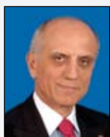
Σπύρος Παπασπύρου Καθηγητής (Αμ. Επ.) Ωτορινολαρυγγολογίας, Διευθυντής της Ωτορινολαρυγγολογικής κλινικής του Νοσοκομείου «Ο ΕΥΑΓΓΕΛΙΣΜΟΣ»