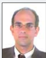
Ιωάννης Μπιζάκης Καθηγητής Πανεπιστημιακής Ωτορινολαρυγγολογικής Κλινικής της Ιατρικής Σχολής του Πανεπιστημίου Λάρισας