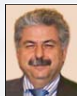
Γεώργιος Βελεγράκης Καθηγητής Διευθυντής της Πανεπιστημιακής Ωτορινολαρυγγολογικής Κλινικής της Ιατρικής Σχολής του Πανεπιστημίου Ηρακλείου Κρήτης