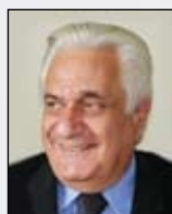
Δημήτριος Κανδηλώρος Καθηγητής Διευθυντής της Β' Ωτορινολαρυγγολογικής Πανεπιστημιακής Κλινικής (Νοσοκομείο Αττικόν) της Ιατρικής Σχολής του Πανεπιστημίου Αθηνών