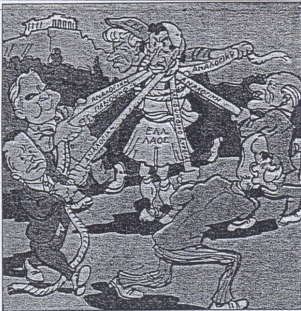
Σκίτσο του Σ. Καρφίς που δημοσιεύθηκε στην εφημερίδα «Εμπρός» και αναφέρεται στο εκλογικό σύστημα που ίσχυε στις εκλογές του 1952

Θα πρέπει ωστόσο να συγκρατήσουμε αυτές τις εκλογές και για έναν ακόμη λόγο, που σήμερα ίσως έχει ξεχαστεί, αλλά τότε αποτέλεσε θέμα έντονης πολιτικής αναπαράθεσης και χαρακτηριστήρισε ως σκάνδαλο. Η στήλη ήταν καιρία για την τύχη της παραδοσιακής «εθνικόφρονος» παράταξης, γιατί για πρώτη φορά ανταποδιδόταν από ένα μόνο κόμμα, που είχε να αντιμετωπίσει στις εκλογές ένα συνασπισμό δημοκρατικών κομμάτων, ανάμεσα στα οποία συμπαράτασσονταν και η ΕΔΑ. Δεν είναι τυχαίο ότι ο συνασπισμός αυτός, που στην ουσία σήμανε την υπέρβαση της σύγκρουσης του εμφυλίου, παρουσιάζονταν από τον κυβερνητικό τύπο ως «λαί-