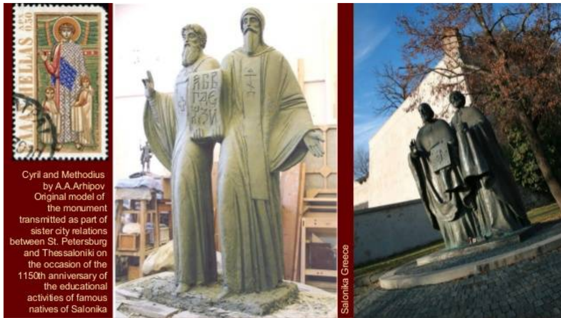
Cyril and Methodius by A.A.Arhipov Original model of the monument transmitted as part of sister city relations between St. Petersburg and Thessaloniki on the occasion of the 1150th anniversary of the educational activities of famous natives of Salonika

https://www.google.com/search?q=ginovski+famous+bulgarian+sculpture&tbm=isch&source=univ&sa=X&ved=2ahUKEwIU27P0jrgAhXBhrQKHxVrBskQ7Al6BAgFEA8&biw=1264&bih=865#imgdii=vIL29N3PtXsjwM:&imgcr=LkERVGVIKc1yuM (7-2-2019):