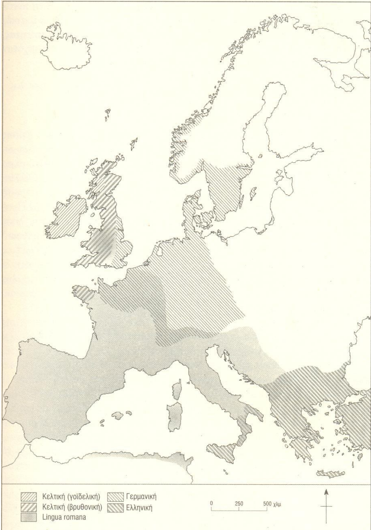
1.2. Κύριες γλωσσικές ζώνες, περί το 500.