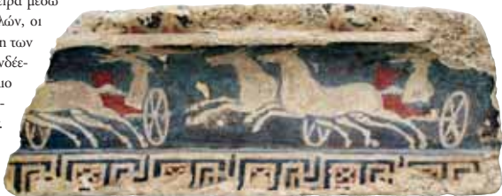
680. Καλυδώνα, Λάφριο. Πήλινη σίμη από τη στέγη του αρχικού ναού της Αρτέμιδος Λαφρίας με παράσταση Νικών πάνω σε άρματα. 4ος αι. π.Χ. Αρχαιολογικό Μουσείο Αγρινίου.

Στον Πελοποννησιακό πόλεμο η περιοχί προσελκύει τις μεγάλες ελληνικές δυνάμεις και υπό αυτές τις συνθήκες ορισμένες από τις μεγαλύτερες πόλεις σχιζώνονται, ανάμεσα σε αυτές η Ναύπακτος και η Χαλκίδα, οι οποίες καταλαμβάνονται από τους Αθηναίους. Μετά τις επιθέσεις των Αθηναίων οι Απωλοί εγκαταλείπουν την ουδετερότητά τους και συντάσσονται με τους Σπαρτιάτες, με τη βοήθεια των οποίων κυριεύουν όλο το δυτικό τμήμα της Λοκρίδας, πλην της Ναυπάκτου. Βρίσκουν έτσι για πρώτη φορά διέξοδο στη θάλασσα, κάτι έως τότε αδύνατο, καθώς τα παράλια ελέγχονταν από την Αθήνα και την Κόρινθο. Για ένα σύντομο διάστημα μετά το τέλος του Πελοποννησιακού πολέμου η Καλυδώνα και η Ναύπακτος κατέχονται από αχαικές φρουρές, από τις οποίες ελευθερώνονται το 367 π.Χ. από τον Θηβαίο Επαμεινώνδα.