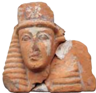
681. Καλυδώνα, Λάφριο. Η διακόσμηση των μετοπίων των καλυπτήρων του αρχαϊκού ναού, με «δαυδικές» έκτυπες γυναικείες κεφαλές με πόλο, και η πολυχρωμία, με χρώματα όπως το λευκό, το μαύρο, το κίτρινο και το κόκκινο, είναι στοιχεία που απαντούν και στον Θέρμο, και συνιστούν τοπικό καλλιτεχνικό στυλ, από το οποίο δέχθηκε αρχικά επιδράσεις και η Κέρκυρα. Από τον ίδιο ναό έχουν σωθεί τμήματα μετοπίων διακοσμημένων με παραστάσεις του Ηρακλή, ήρωα που κατέχει σημαντικό ρόλο στις μυθολογικές παραδόσεις της Καλυδώνας. Τέλος 7ου αι. π.Χ. Αρχαιολογικό Μουσείο Αγρινίου.