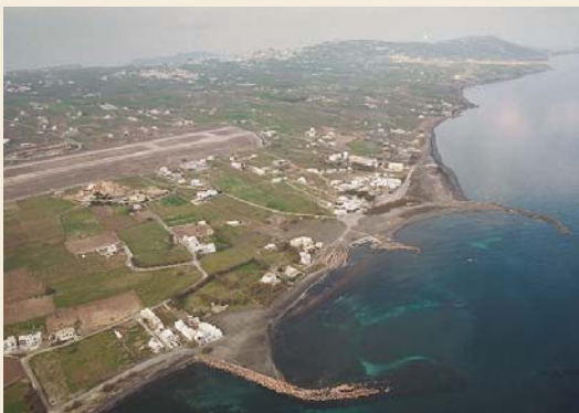
Εικ. 1. Ο Μονόλιθος, δίπλα στο αεροδρόμιο του νησιού, όπως φαίνεται από αέρος (2002).

Ο Μονόλιθος είναι ένα βραχώδες ύψωμα, ύψους 29 μ., που διακρίνεται με τον όγκο του στην πεδινή ανατολική παράλια ζώνη της Θήρας (εικ. 1). Στη συμπαγή όψη της ασβεστολιθικής του σύστασης οφείλει, άλλωστε, και το σύγχρονο όνομά του. Βρίσκεται πολύ κοντά στο αεροδρόμιο του νησιού, λίγα μέτρα ανατολικά του διαδρόμου προσγείωσης, και σε μικρή απόσταση από τη θάλασσα. Στην προεκρηξιακή Σαντορίνη, ωστόσο, ο Μονόλιθος ήταν νησί-δα που απείχε λίγα μέτρα από την ανατολική ακτή, όπως έχουν απο-