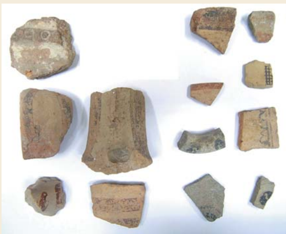
Εικ. 3. Όστρακα ύστερων μυκηναϊκών αγγείων (κυρίως 12ου αι. π.Χ.), που περισυνελέγησαν από τον καθ. J. W. Sperling το 1971. Λαβές και κείλη νδροφόρων και αγγείων πόσεως, διακοσμητικά δέματα δικτυωτού, τριγλύφων και κύκλων. Πάνω αριστερά πόδος με εμπίεστη διακόσμηση κύκλων. Αρχαιολογικό Μουσείο Θήρας.