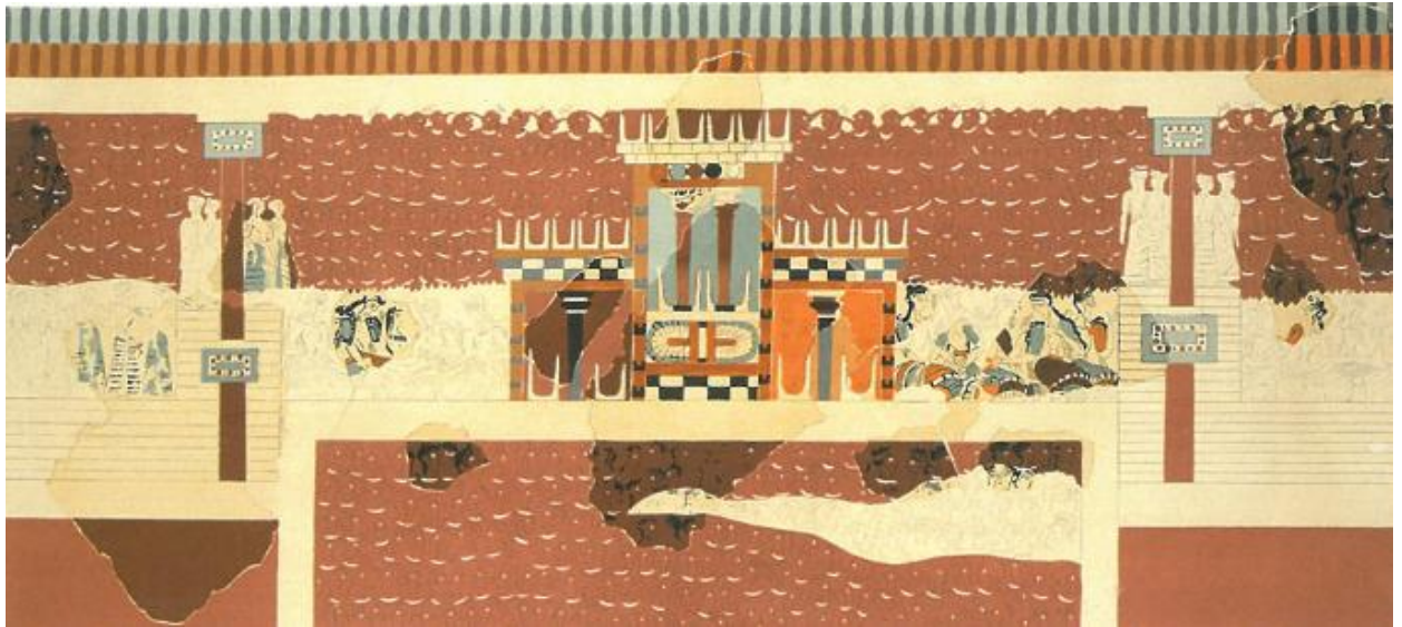
Εικ. 1: Μικρογραφική τοιχογραφία του «Τριμερούς Ιερού», Κνωσός. Αποκατάσταση του Mark Cameron (Hood 2005, Πιν. 10.1).