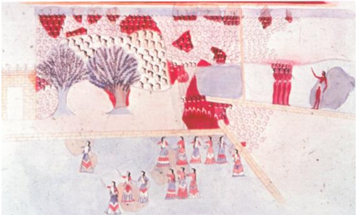
Εικ. 2: Μικρογραφική τοιχογραφία του «Ιερού Άλσους και του Χορού», Κνωσός. Αποκατάσταση του Mark Cameron (Hood 2005, Πιν. 10.2).