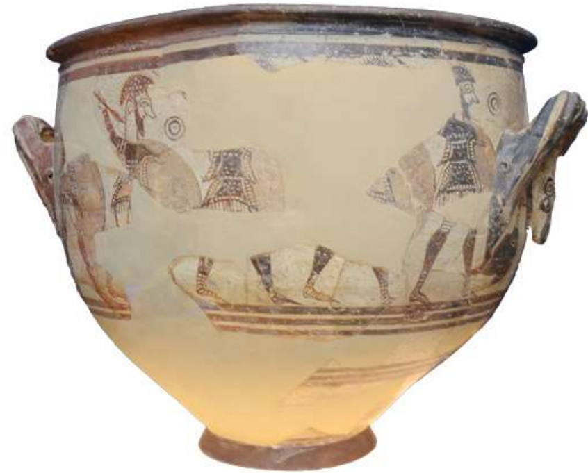
Κρατήρας των Πολεμιστών (όψη Β).

Οικία του «Κρατήρα των Πολεμιστών», Ακρόπολη Μυκηνών. 12ος αι. π.Χ. Έκθεση Μυκηναϊκών Αρχαιοτήτων, αρ. ευρ. Π1426, Αίθουσα 4, προθήκη Μ19.