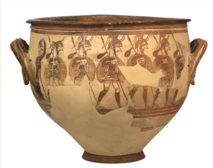
Κρατήρας των Πολεμιστών, ΕΑΜ Π1426