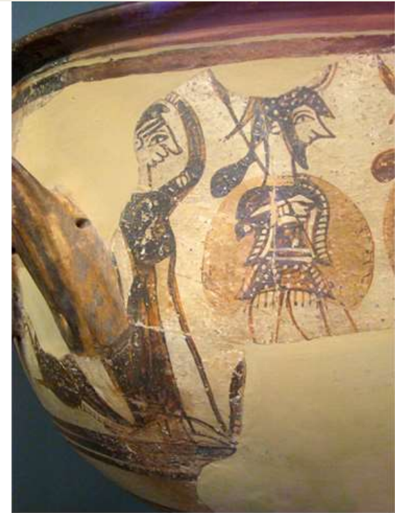
Κρατήρας των Πολεμιστών (λεπτομέρεια).

Οικία του «Κρατήρα των Πολεμιστών», Ακρόπολη Μυκηνών. 12ος αι. π.Χ..