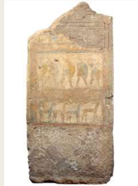
Λίθινη στήλη, ΕΑΜ Π3256