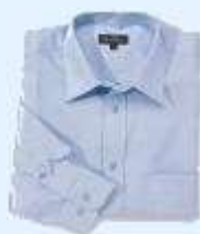
Une chemise (à manches longues)